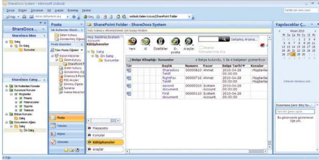
ShareDocs Microsoft Office ve Outlook Entegrasyon Ekran Görüntüsü

SHAREDOCS Transforming Data into Knowledge